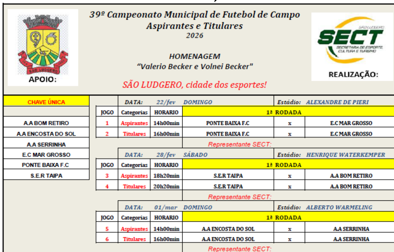
TABELA DE JOGOS